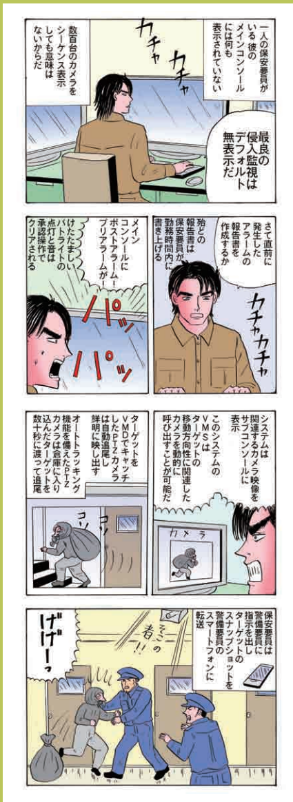
Genetec社Security Center mobileでご利用いただけます。詳しくは http://www.javatel.co.jp で。

営業時間中に侵入モードで運用した場合はアラームのオンパレードになってしまう。この場合はVMS側でVMDイベントをスルーするように変更する。これらはスケジューリング管理可能である。営業時間中は群衆管理が基本となる。しかし、一台のカメラでVMDと群衆管理をスケジューリングして使うのはほとんど不可能である。次は群衆管理へ